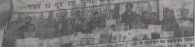
अबोहर, 28 नवंबर @ जंग-ए-समाचार। हनुमानगढ़ रोड पर